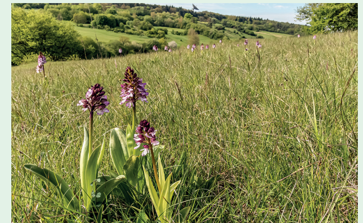
Biotop mit Orchis purpurea – Purpur-Knabenkraut