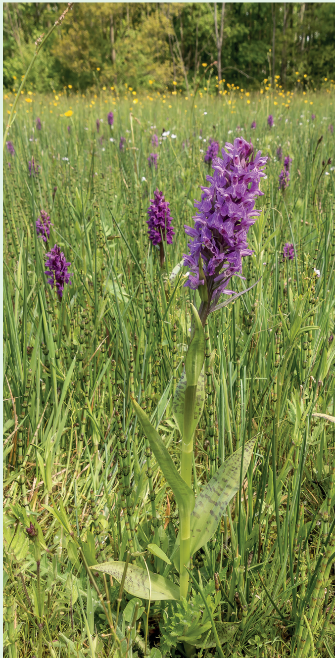
Dactylorhiza majalis – Breitblättriges Knabenkraut Gefährdete Orchideenart in NRW Verantwortungsart für Deutschland

Weiterführende Informationen (regionale Ansprechpartner, Termine, Kartierungsanleitung, Artenvorstellung) finden Sie auf unserer Homepage www.aho-nrw.de