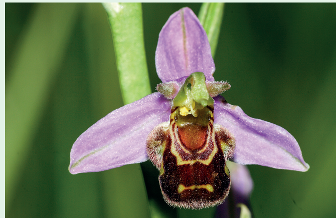
Ophrys apifera – Bienenragwurz