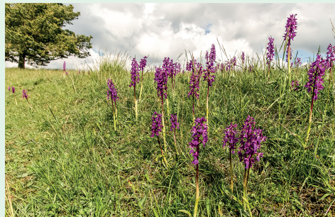
Orchis mascula – Manns-Knabenkraut

3. Beratung zur Unterschutzstellung von wertvollen Biotopen