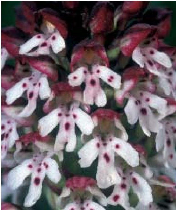
Ausschnitt aus einem Blütenstand von Orchis ustulata

Das Brandknabenkraut tritt in Deutschland in zwei Varietäten auf – eine im Mai bis Juni blühende Normalform ( Orchis ustulata var. ustulata ) und eine ca. zwei Monat später blü-