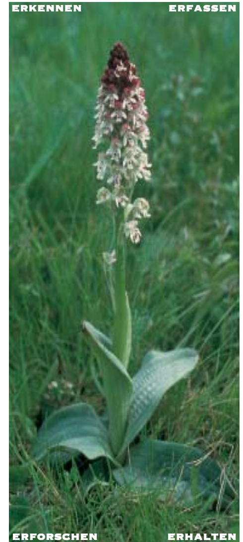
Brand-Knabenkraut Orchis ustulata L.