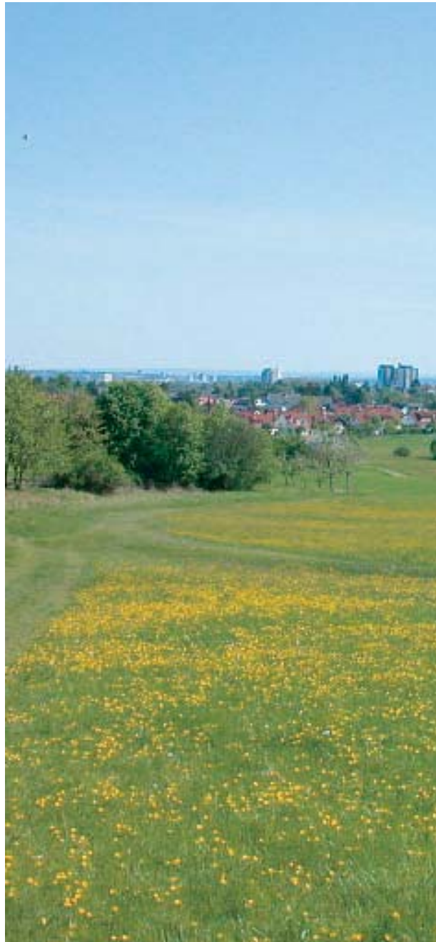
Lebensraum des Brand-Knabenkrauts in siedlungsnahen, frischen Hahnenfußwiesen